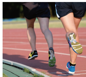
総合スポーツ施設など