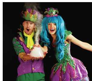
演劇舞台・ミュージカルなど