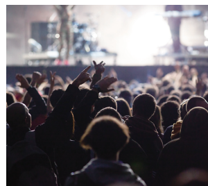
ライブ・コンサートなど