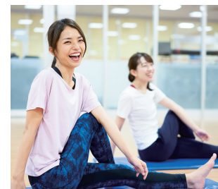
ジム・スポーツクラブなど