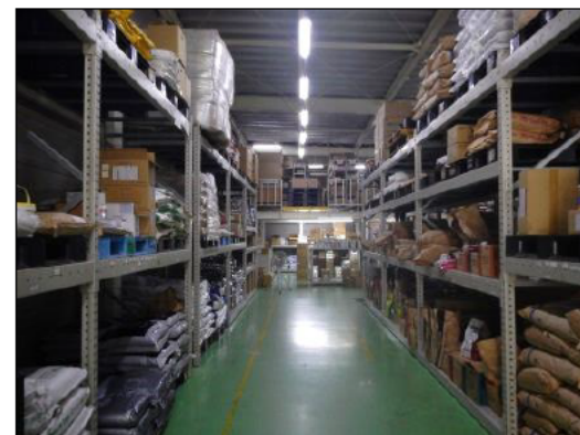
取り扱っている薬品